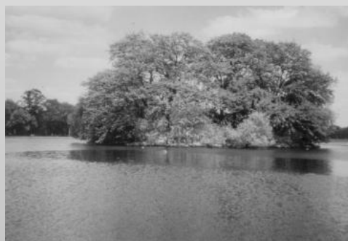
Obrázok 2 Jazero po vyliatí oleja na hladinu