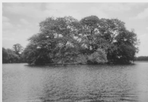
Obrázok 1 Jazero pred vyliatím oleja na hladinu

V osemnástom storočí sa na prepravu tovaru zo zámorských štátov využívali lode. Problém pri ich plavbe často spôsobovalo rozburácané more a vlny. A vedci sa snažili tieto vlny utíšiť. V roku 1775 bola dokonca vypísaná odmena 30 dukátov pre toho, kto príde s najlepším riešením! Jedným z nich bolo zistenie, že olivový olej, rozliaty na vodnú hladinu, dokáže vlny upokojiť. Experiment realizoval Benjamin Franklin, ktorý o ňom napísal: „ Išiel som na náveternú stranu jazera, kde sa začínali tvoriť vlny a na hladinu som nalial nie viac ako čajovú lyžičku olivového oleja. Tá okamžite utišila vlny na ploche, ktorá sa postupne rozšírila až na štvrtinu rybníka, čo je asi polovica akra (teda 2023 m 2 ). Takže štvrtina rybníka bola hladká ako zrkadlo... “. Dnes už vieme, že olej sa po hladine rozliat tak, že vytvoril jednomolekulovú vrstvu. Teda olejová škvrna ktorá vznikla, bola hrubá práve tak, ako je dlhá jedna molekula oleja!